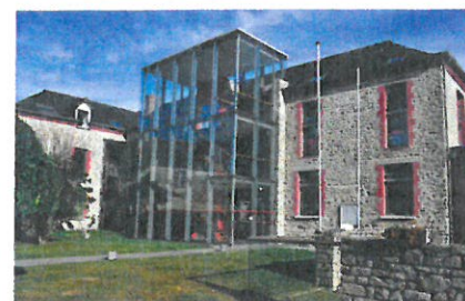
PÔLE DE PROXIMITÉ Espace Sainte-Anne 22230 MERDRIGNAC Tél : 02 96 67 45 45