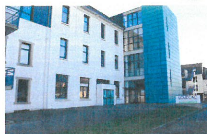
LOUDEAC Communauté BRETAGNE CENTRE 4 / 6 Bd de la Gare 22 600 LOUDEAC Tél : 02 96 66 09 09