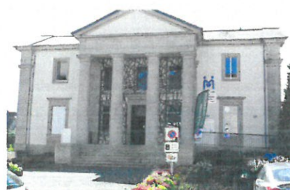
Maison des Services Au Public 15, rue Moncontour 22 600 LOUDEAC Tél : 02 96 66 48 37

UN TERRITOIRE DE 1 170 KM 2 42 COMMUNES PRÈS DE 52 000 HABITANTS